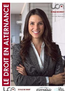
Livret de l'alternance