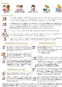
Procédure de mise en place d'un contrat d'alternance

Documents à retrouver sur le site de l'Ecole de Droit (rubrique Alternance)